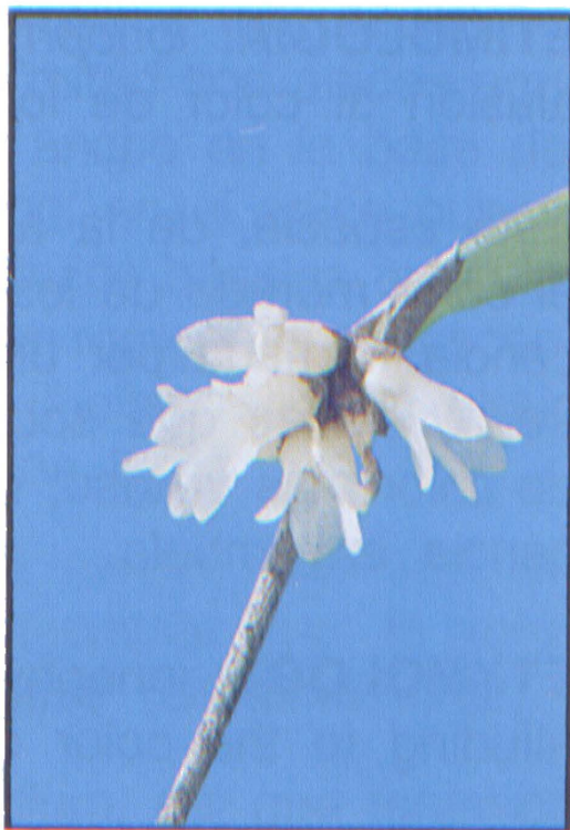
MYOXANTHUS MONTANUS Ortiz

pid bracts, flowers white with hispid ovaries, sepals connate to the middle, petals oblong and narrow, tapering near the obtuse apex, the lip oblong and subpandurate with a truncated apex.