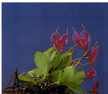
L. TSUBOTAE Cultivo: Shigenobu Tsubota