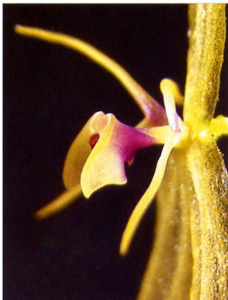
LEPANTHES DEBEDOUTII P. Ortiz, sp. nov. Fotografía y cultivo: Ramón De Bedout H.