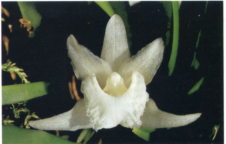
Kefersteinia lafontainei , Holotypus aus Franz. Guyana

Holotypus: Herbarium Institut für Systematische Botanik Heidelberg ( HEID ); cult. Botanischer Garten Heidelberg sub 0-19548; coll. A. LAFONTAINE, Franz. Guyana, am Ufer des Orapu, ca. 50 km südlich Cayenne, nur wenig oberhalb N.N.