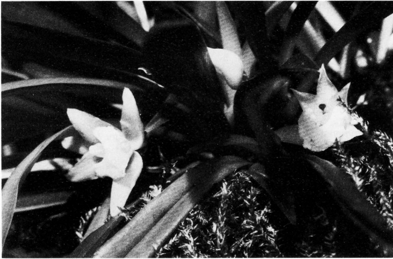
Kefersteinia lafontainei , Holotypus – aus Franz. Guyana